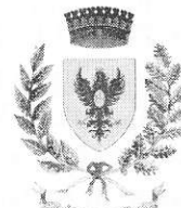
Comune di San Salvatore di Fitalia